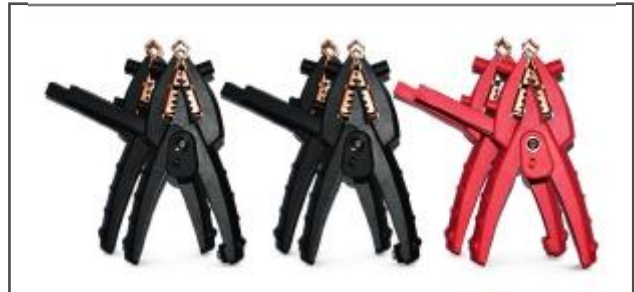
HVB 10 Klemmen

Max. Fehlerwiderstand bei 10 kV an einem 1 km langen Kabel mit definiertem Querschnitt; Fehlerort bei 50 % der Kabellänge: